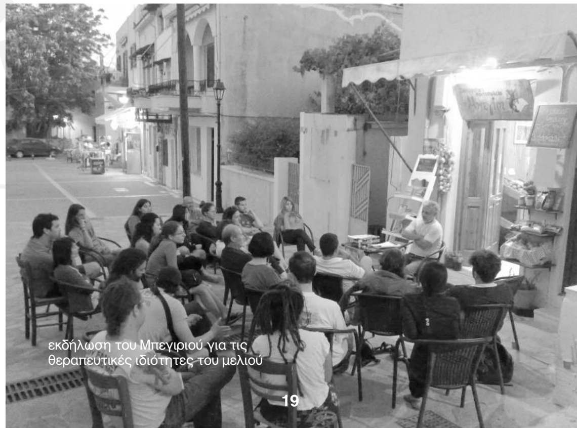
εκδήλωση του Μπεγιριού για τις θεραπευτικές ιδιότητες του μελιού