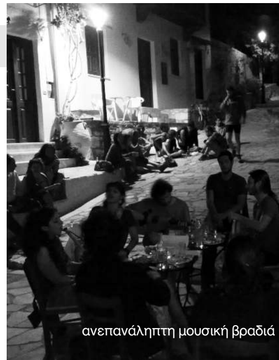
ανεπανάληπτη μουσική βραδιά

• Η αποδοχή και ένταξη ενός εγχειρήματος που βασίζεται στον εργατικό έλεγχο σε ένα κρατικό-επιχειρηματικό πλάνο (π.χ. ΕΣΠΑ) φέρνει το ίδιο το εγχείρημα σε αναντιστοιχία με τον ίδιο τον εαυτό. Για εμάς, η κοινωνική αυτοδιαχείριση (και όχι απλά η εργατική) στηρίζεται στην ιδέα της ρήξης, αποτελεί ριζοσπαστική διαδικασία κοινωνικού μετασχηματισμού και προϋποθέτει αλλαγές πραγματοποιούμενες από τα κάτω, που δίνουν τις εμπειρίες της