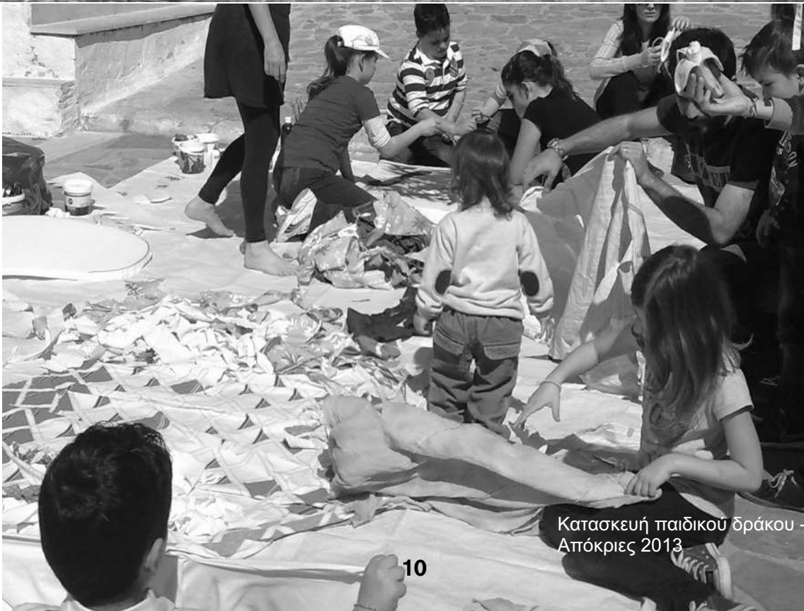
Κατασκευή παιδικού δράκου - Απόκριες 2013

δεύτερο επίπεδο θα μπορούσαν να το ενισχύουν αντίστοιχα εγχειρήματα του εξωτερικού.