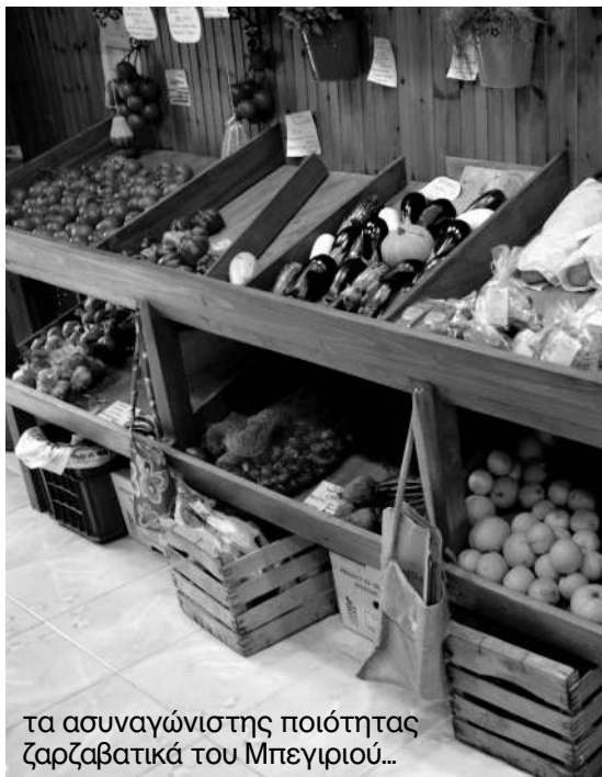
τα ασυναγώνιστης ποιότητας ζαρζαβατικά του Μπεγριού...

• Για να μην ξεκινάμε από το μηδέν κάνοντας κύκλους κάθε φορά γύρω από τον εαυτό μας και εφόσον η εμπειρία γύρω από τις δομές