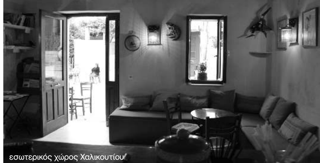
εσωτερικός χώρος Χαλικουτίου