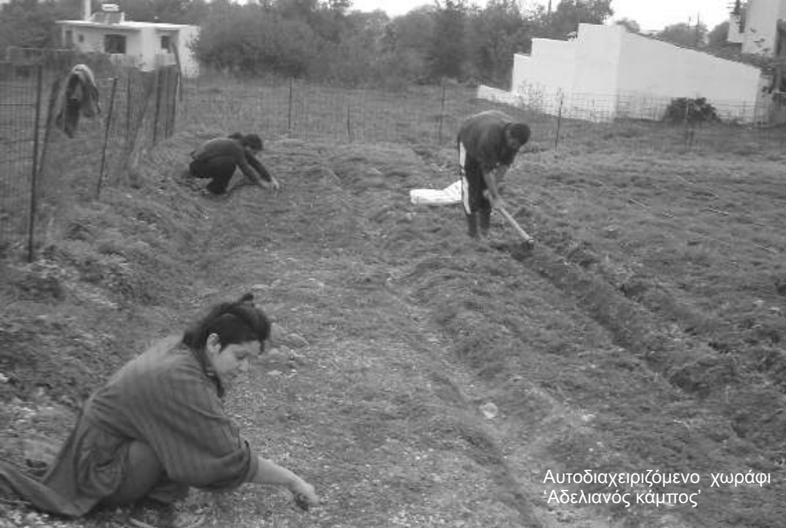
Αυτοδιαχειριζόμενο χωράφι 'Αδελιανός κάμπος'