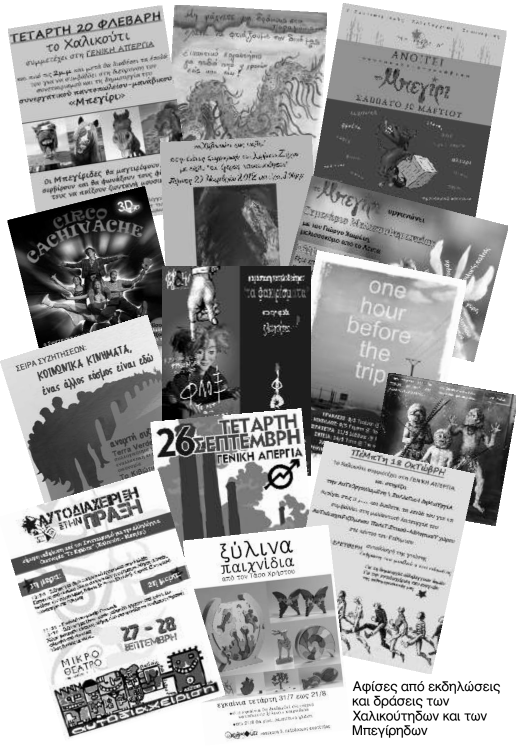
Αφίσες από εκδηλώσεις και δράσεις των Χαλκούτηδων και των Μπεγίρηδων